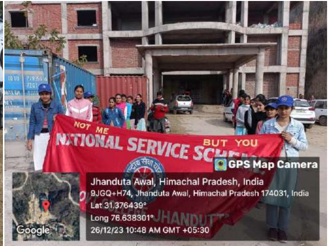
Category 5.3: Social Impact of Various Activities: